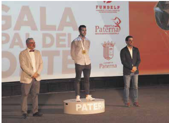
Instante de la Gala del Deporte 2023

Por su parte, Sagredo quiso dedicar unas palabras a los y las deportistas de la ciudad, destacando que son "ejemplo de esfuerzo, de trabajo duro, de ilusión, de superación y de éxito. Personas y clubs que lleváis el nombre de Paterna allá donde vais y que nos servís de inspiración a quienes practicamos y